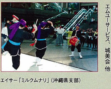
エイサー「ミルクムナリ」（沖縄県支部）

◎東北の民謡踊りと太鼓（東北支部） ◎詩吟および剣舞（関東支部） ◎高山陣屋太鼓（岐阜県支部） ◎「エイサー」ミルクムナリ （沖縄県支部） ◎白鳥ホールグループス出演 名城大学、附属高等学校、 エムユーサービス、城美会他