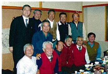
農学部懇親会 (12月1日)