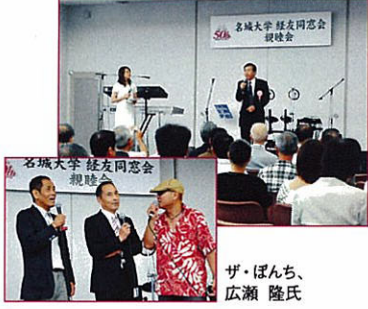
ザ・ぼんち、 広瀬 隆氏

・めるへん堂ミニコンサート ザ・ぼんち お笑いステージ 広瀬隆 C.B.Cアナウンサー丸山蘭那 ①広瀬隆とザ・ぼんちによるトークショー ②ミニコンサート「めるへん堂」 ③ザ・ぼんち お笑いステージ ・抽選会 台湾旅行ご招待 10数名