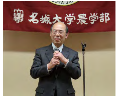
船隈学術研究支援センター長 祝辞