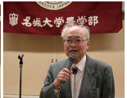
橋本先生ごあいさつ