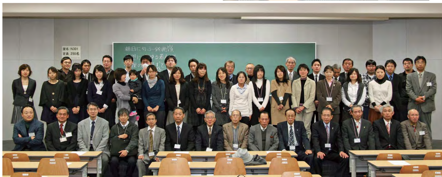
2011年度（平成23年度）農学部同窓会総会 記念写真 若い女性が多いことが農学部同窓会総会の特徴です。（29期生と同窓会役員はホームカミングディに出席のため，ここにはおられません）