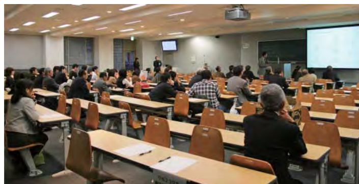
総会会場の様子（少々，まばらか？）