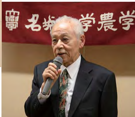
岡留先生ごあいさつ