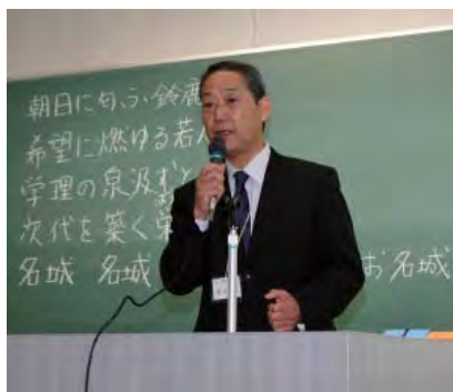
奥田同窓会会長挨拶。黒板は校歌歌詞。