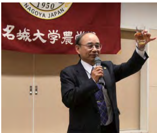
岩室校友会副会長による乾杯。