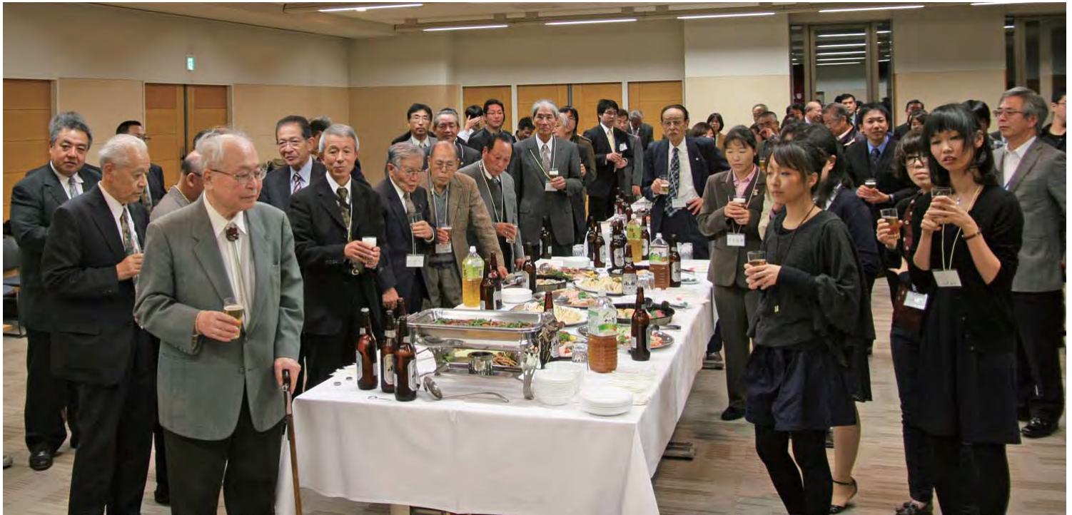
乾杯を心待ちにしている参加者たち